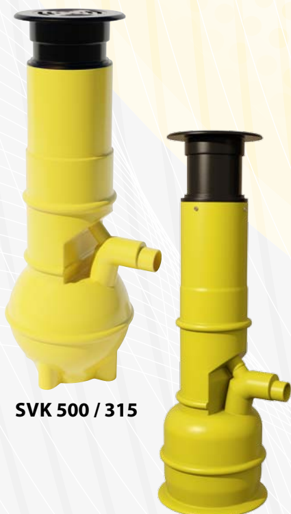
SVK 500 / 315