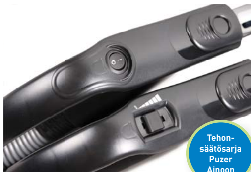
Kahvakäynnistys- ja tehonsäätökahvat